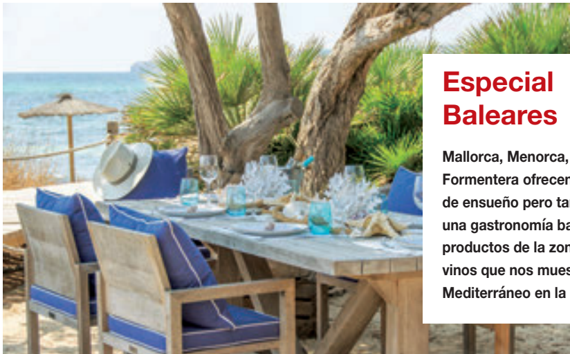
Gecko Hotel & Beach Club - Formentera