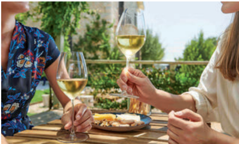
Vinos de Jerez

Mallorca, Menorca, Ibiza y Formentera ofrecen playas de ensueño pero también una gastronomía basada en productos de la zona y unos vinos que nos muestran el Mediterráneo en la copa.