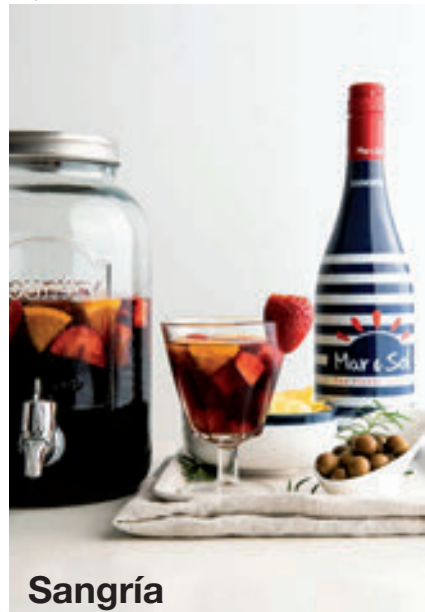
Sangría Mar & Sol

A los más puristas lo de envasar el vino en una lata en lugar de embotellarlo no les convence, pero hay que rendirse a la evidencia, los tiempos cambian y las necesidades también. El vino en lata ha llegado para quedarse por ser un formato práctico que permite su consumo en cualquier lugar y en cualquier momento.