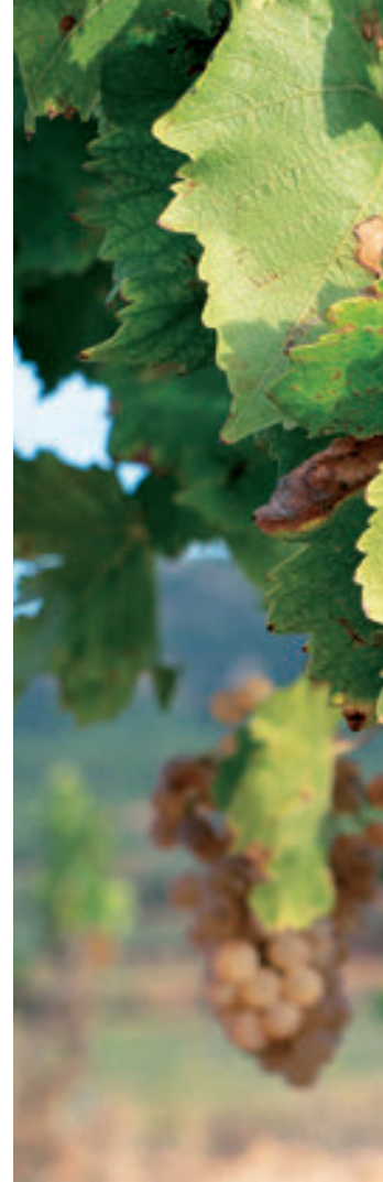
D.O. Terra Alta

L a garnacha blanca se cultiva en España desde hace siglos. Se cree que se originó en la provincia de Zaragoza, en el extremo nororiental del país. Al parecer, la uva fue introducida por primera vez en la zona por los romanos en el siglo I d.C.