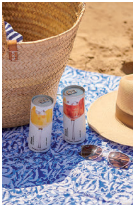
Glass Canned Wines

Su calidad ha mejorado exponencialmente en los últimos años gracias a las sangrías premium , que lucen una estética sofisticada y están elaboradas con vino de calidad. Sin duda, la mejor manera de dar la bienvenida al verano, al terraceo , a los chiringuitos de playa y a los beach clubs .